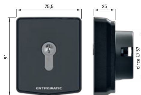
AXK5I - AXK5NI (versione senza cilindro)